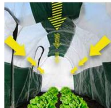
In das Dach verschweisste Schattierflächen