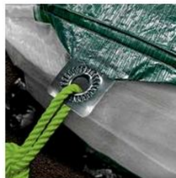
Abspannseile und Bodenheringe inklusive